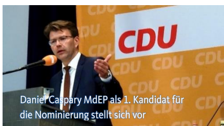
Daniel Caspary MdEP als 1. Kandidat für die Nominierung stellt sich vor

Daniel Caspary ging auf die Sicherheit im Datenverkehr, der Finanzpolitik und der Investitionen ein, die auch für baden-württembergische Projekte für sichere Arbeitsplätze Sorge. Er wurde mit 91,2 Prozent, von den über 150 anwesenden Delegierten wieder zum Spitzenkandidaten für den Listenplatz 2a der Landesliste gewählt.