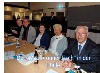
Der „Maulbronner Tisch“ in der Halle

Am 9. März Kreisparteitag in Königsbach, der als Kreismitgliederversammlung 2 Kandidaten als Delegierte für die am 14. April stattfindende Nominierungsversammlung zur Wahl des/der Europawahl-Kandidaten festgelegt hatte.