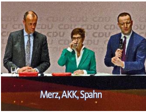
Merz, AKK, Spahn

Spannende Bezirkskonferenz bei der Vorstellung der CDU-Vorsitzenden-Kandidatin und den Kandidaten in Böblingen: Friedrich Merz, Annegret Kramp-Karrenbauer (AKK) und Jens Spahn kämpfen um die Gunst der CDU-Mitglieder. Gewählt wurde am 7. Dezember die ehemalige Generalsekretärin AKK.