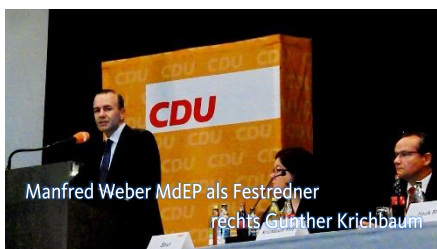
Manfred Weber MdEP als Festredner rechts Gunther Krichbaum

Dann am 14. April in der Kirnbachhalle in Niefern die Nominierung der Bewerber/-innen zur Aufstellung der Landesliste für die Wahl zum 9. Europäischen Parlament. Der Fraktionsvorsitzende der EVP im Europäischen Parlament, Manfred Weber MdEP, sprach von einer gefährlichen Entwicklung von Populismus. Er selbst kämpfe mit Gradlinigkeit und Verantwortung Europa zusammen zu halten.