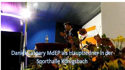
Daniel Caspary MdEP als Hauptredner in der Sporthalle Königsbach

Am 9. März Kreisparteitag in Königsbach, der als Kreismitgliederversammlung 2 Kandidaten als Delegierte für die am 14. April stattfindende Nominierungsversammlung zur Wahl des/der Europawahl-Kandidaten festgelegt hatte.