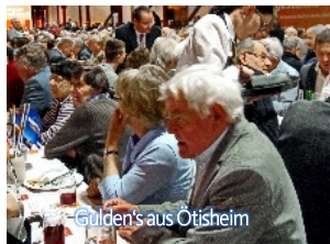
Gäste aus Ötisheim