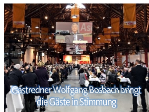
Gastredner Wolfgang Bosbach bringt die Gäste in Stimmung

Am 1. März lud der CDU-Kreisverband Enzkreis/Pforzheim wieder zum Politischen Aschermittwoch in die „Alte Kelter“ nach Fellbach ein.