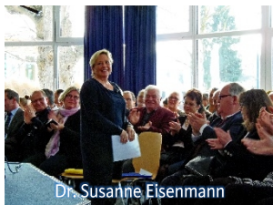
Dr. Susanne Eisenmann

Die BW-Ministerin für Kultus, Jugend und Sport, Dr. Susanne Eisenmann , sprach am 15. Januar beim Neujahrsempfang der CDU Mühlacker in der Musikschule Gutmann vielen aus dem Herzen und deutliche Worte zur Bildungspolitik. Ruhe und Verlässlichkeit werde gebraucht: „ständige Strukturdiskussionen und Reformansätze bringen Unruhe ins System“.