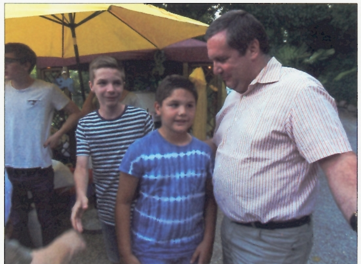
Zu den Gästen des Sommerfestes zählte auch der ehemalige baden-württembergische Ministerpräsident, Stefan Mappus